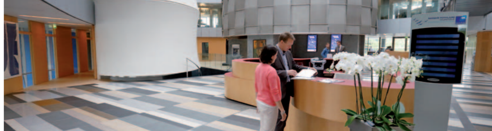
> Une banque responsable qui tient le cap qu'elle s'est fixé

La Banque Populaire Atlantique est la digne héritière d'une longue tradition d'entraide et de valeurs. Une tradition qui perdure avec la création, en 2010, d'une fondation d'entreprise « pour soutenir les magnifiques initiatives associatives de notre territoire ». Qu'elles soient clientes ou non, les associations peuvent déposer un dossier, étudié par